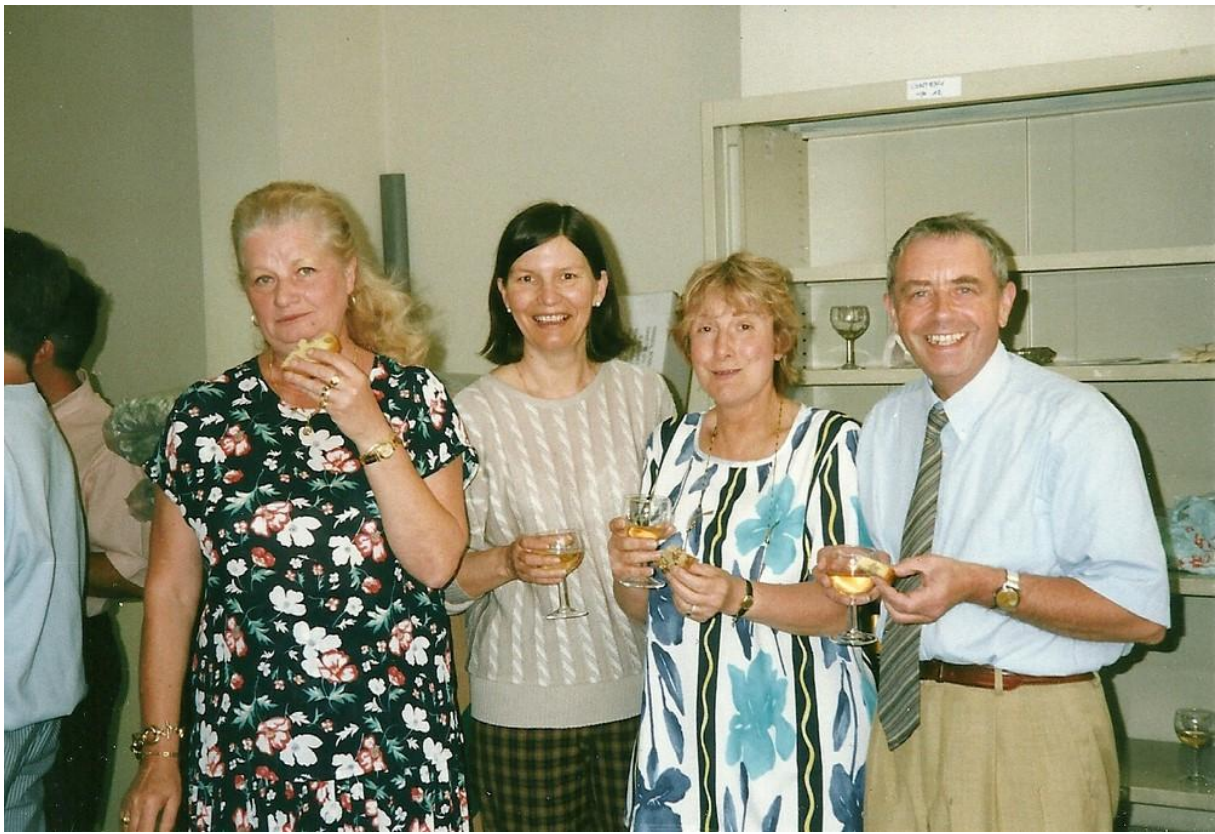
1976 Sortie CE au Tyrol