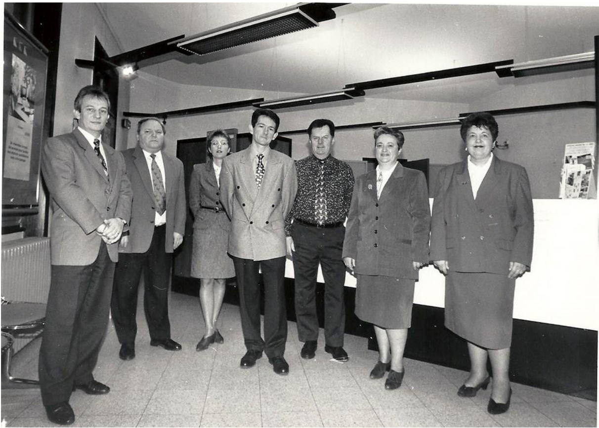
1996 Reunion Groupe