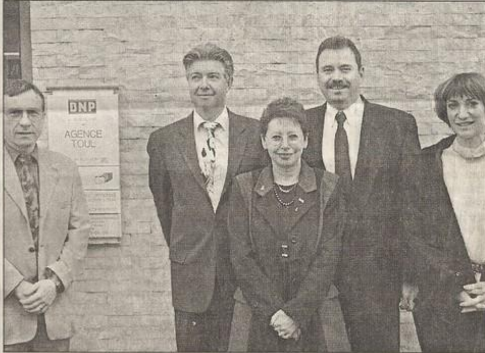
Le nouveau directeur retrouve ses anciens collègues.

Nous lui souhaitons une bonne installation.