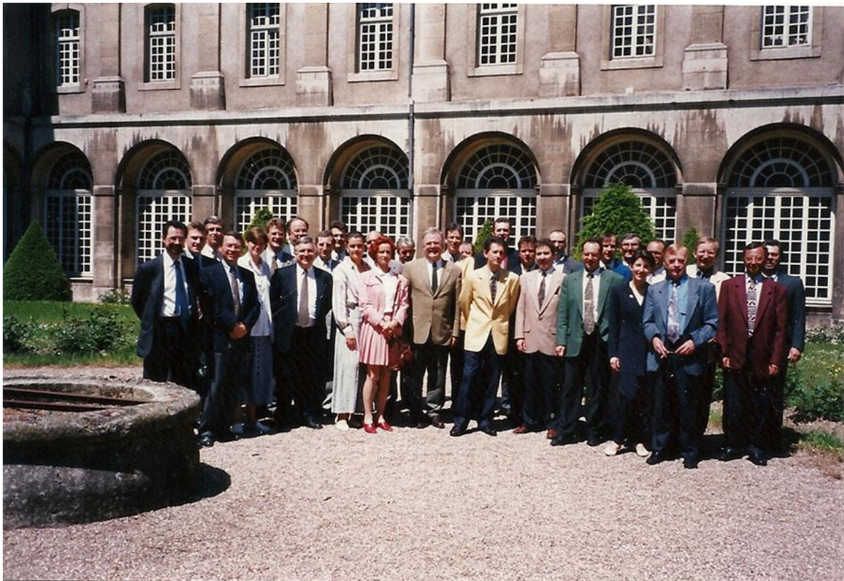
Réunion 30/5/1996 - Groupe NANCY à l'Abbaye des Prémontrés